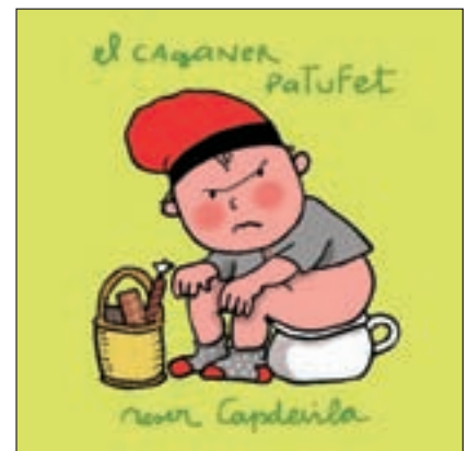
El Caganer Roser Capdevila 2007