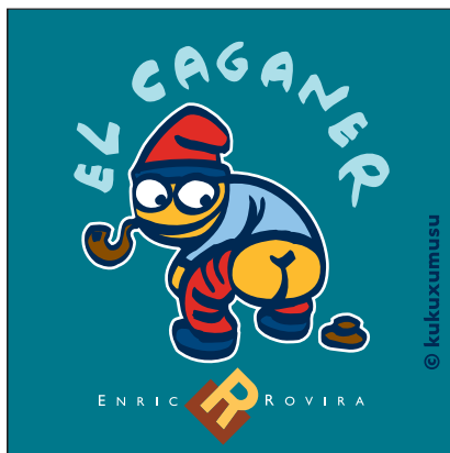
El Caganer Kukuxumusu 2004-2005