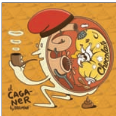
El Caganer Brosmind 2008