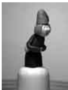
Didal de ceràmica