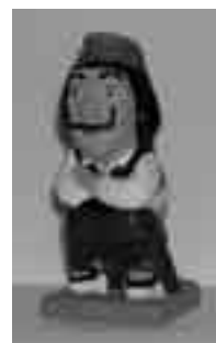
Dalí de l'Anna M. Pla