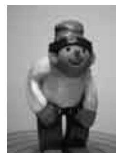
Català de ceràmica