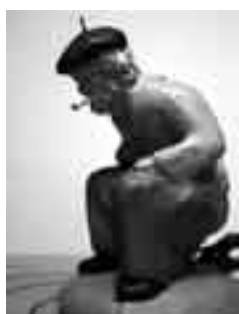
Basc de Múrcia