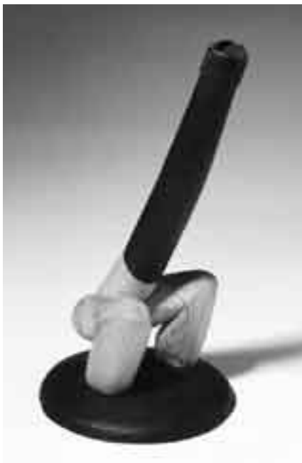
Galeria Contrast. Nadal 1997