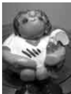
Selecció catalana d'hoquei de ceràmica