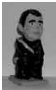
Príncep de l'Anna M. Pla