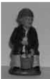
Boletaire de Múrcia