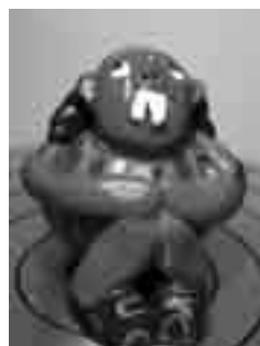
Ronaldinho de ceràmica