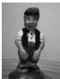
Català I de l'Aurora