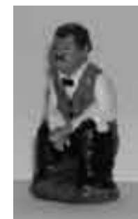
Cambrer de Múrcia