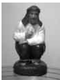
Hebreu de l'Aurora