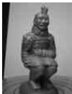
Guerrer de Xiang