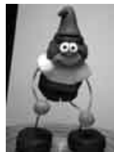
Filferro i ceràmica