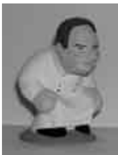
Ferran Adrià de Scaramuix