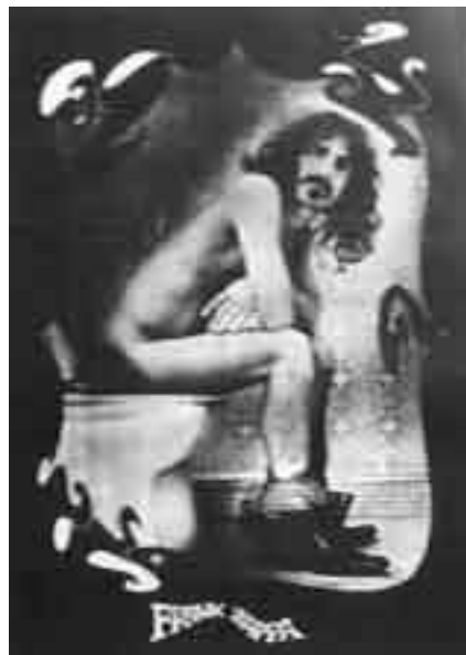
Pòster Frank Zappa. Anys 60