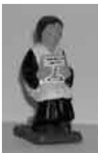
Escolanet de l'Anna M. Pla