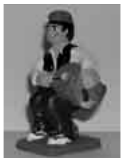
Timbaler del Bruc de l'Anna M. Pla