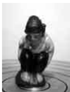
Català de Múrcia