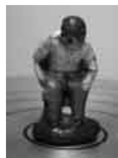
Caganer català de plom