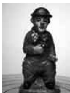
Pallasso de Múrcia