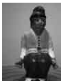
Català II de l'Aurora