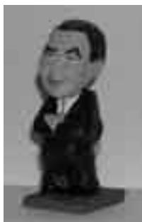
ZP de l'Anna M. Pla