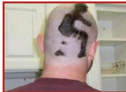
Pentinat a l'estil caganer

Retallable amb moviment creat i dissenyat per l'Il·lustrador Lluís Filella